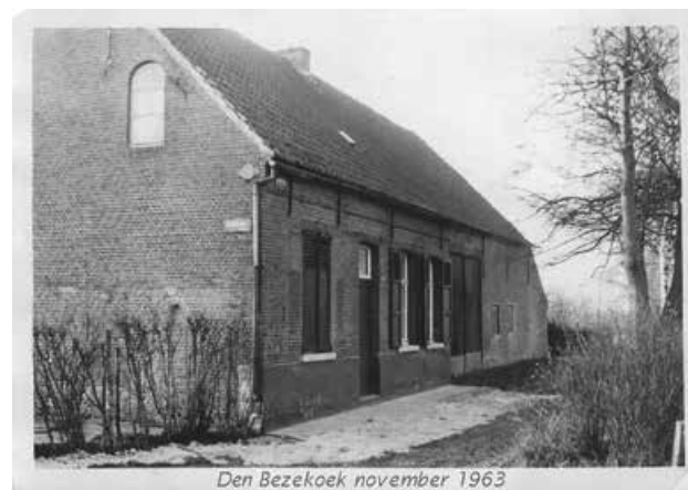
Den Bezenkoek november 1963

Halfweg de Sinaaiwegel ontdekken we aan de rechterzijde een riant villa. Hier stond ooit de Bezenkoek, de herberg die zijn naam gaf aan dit gebied . Omdat de bodem hier droog en zanderig is en omdat deze plek tussen andere dorpen in ligt, is hier nooit veel bewoning geweest. Toch was de herberg in zijn tijd een populaire trekpleister, met name voor wandelaars en bedevaarders. Op weekdagen was het er rustig, maar tijdens het weekend was het een drukte van jewelste. Er werd gekaart, gebolderd en zelfs geschoten met luchtgeweren! De schietschijf hing boven het fornuis aan de schouw, waardoor de waardin de kogeltjes regelmatig boven haar hoofd hoorde suizen wanneer ze aan de kookpot stond!